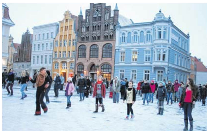
Tanzen gegen Gewalt: Viele Stralsunder folgten dem Aufruf und kamen gestern um 17 Uhr zum Alten Markt.

Im vergangenen Jahr wurde die Kampagne „One billion rising“ ins Leben gerufen, auf Grundlage einer alarmierenden Statistik, dass eine von drei Frauen weltweit im Laufe ihres Lebens geschlagen oder vergewaltigt wird. mwe